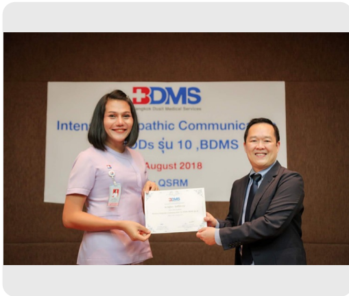
หลักสูตร1เดือน Empathic commutation for HOD (จัดโดยBDMS)