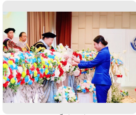
รับรางวัลศิษย์เก่าดีเด่น พยาบาล