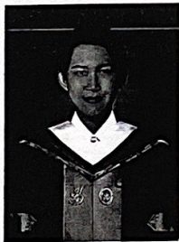
นายทะเบียนลงนามทับรูป

ตั้งแต่วันที่ 27 เดือน กุมภาพันธ์ พ.ศ. 2563 ให้ไว้ ณ วันที่ 28 เดือน กุมภาพันธ์ พ.ศ. 2563