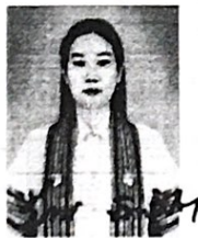
ภาพถ่ายเขียนลงนามทับรูป

ตั้งแต่วันที่ 15 เดือน มิถุนายน พ.ศ. 2563 ให้ไว้ ณ วันที่ 18 เดือน มิถุนายน พ.ศ. 2563